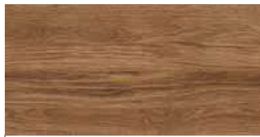
COD. 09 ROVERE NATURALE | NATURAL OAK

SOLO PER STRUTTURA MOBILI CONTENITORI only for cabinets structure