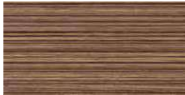
COD. 13 NOCE MODERNO | MODERN WALNUT