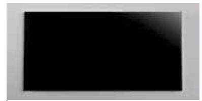
COD. 10 NERO | BLACK

ANTE VETRO MOBILI MONOLITICI glass doors for monolith cabinets