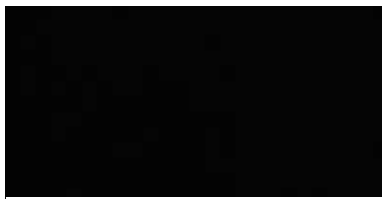
COD. 51 NERO | BLACK

SOLO PER STRUTTURA MOBILI CONTENITORI only for cabinets structure