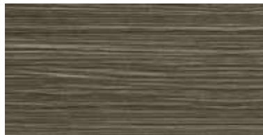
COD. 64 PIOPPO LIGHT | LIGHT POPLAR